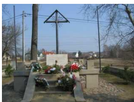
5. Pomnik Bohaterów Olszynki Grochowskiej