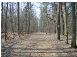
3. Las Wawerski im. Jana III Sobieskiego