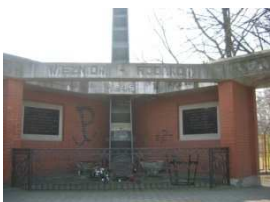
2. Pomnik więźniów obozu NKWD