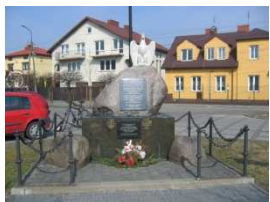
1. Pomnik Jaworzniaków